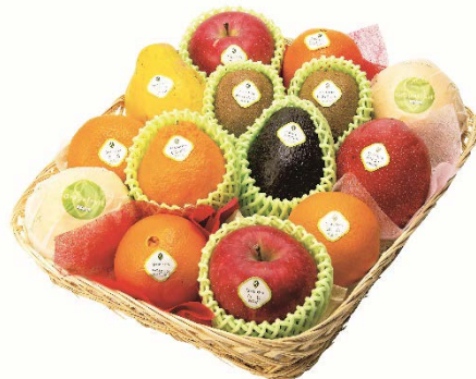
※写真はイメージです。入荷状況によって詰め合せ内容が変更になる場合があります。

今回は、「おいしく果実シリーズ」のリニューアルを記念し、日本橋 千疋屋総本店がおすすめる季節のフルーツ詰め合せセットが当たるキャンペーンを実施。この時期ならではの、みずみずしいおいしさの果実詰め合せを抽選で100名様にプレゼントいたします。はずれた方にもダブルチャンスとして「ペアヨーグルトボウル」を900名様にプレゼント。フルーツいっぱいのヨーグルトのように、彩り豊かな食卓をお楽しみ下さい。